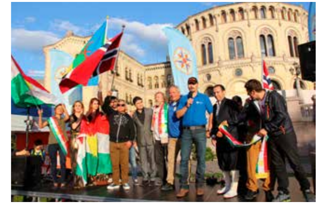
APPELLER: Alle som holdt appeller under PDKs støttemarkering for et selvstendig Kurdistan samlet foran Stortinget.

Norge er en stor humanitær aktør i Irak, og mesteparten av den humanitære innsatsen går til de kurdiske områdene. Vi merker også ellers synspunktene fra Partiet De Kristne om norsk anerkjennelse av Kurdistan som stat, støtte til den kurdiske Peshmerga med våpen og materiell og oppfordring om å gi 10 millioner kroner til særskilte tiltak og oppfølging av traumatiserte kvinner og barn.